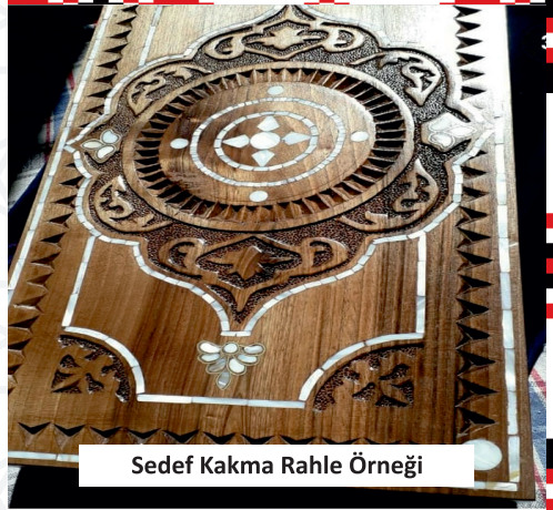
Sedef Kakma Rahle Örneği