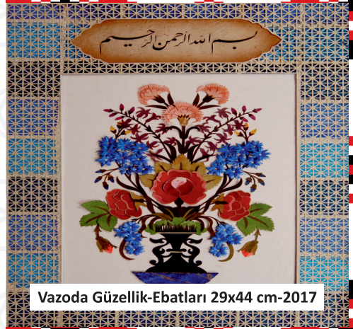
Vazoda Güzellik-Ebatları 29x44 cm-2017