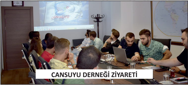
CANSUYU DERNEĞİ ZİYARETİ