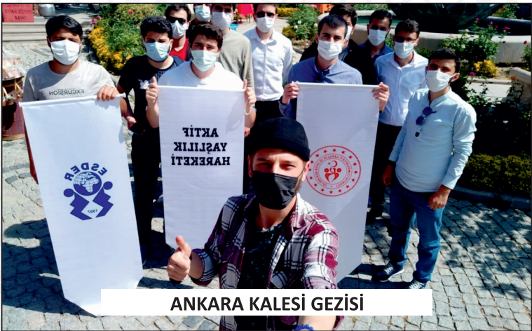
ANKARA KALESİ GEZİSİ