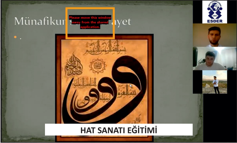
HAT SANATI EĞİTİMİ