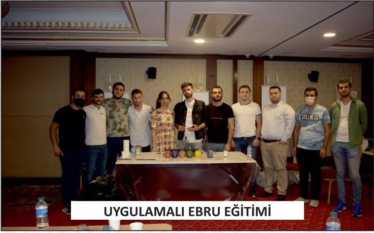
UYGULAMALI EBRU EĞİTİMİ