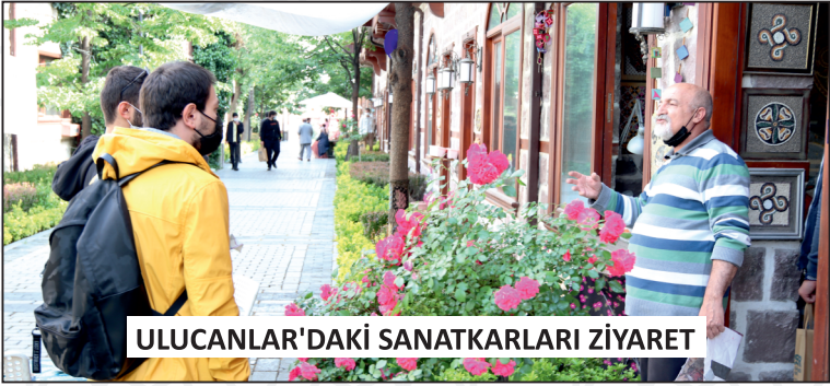
ULUCANLAR'DAKİ SANATKARLARI ZİYARET