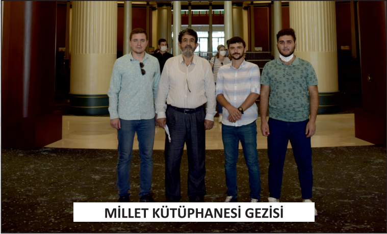
MİLLET KÜTÜPHANESİ GEZİSİ