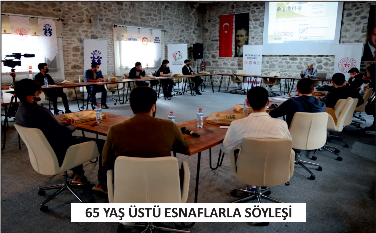
65 YAŞ ÜSTÜ ESNAFLARLA SÖYLEŞİ