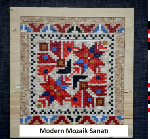
Modern Mozaik Sanatı