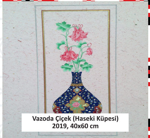
Vazoda Çiçek (Haseki Küpesi) 2019, 40x60 cm