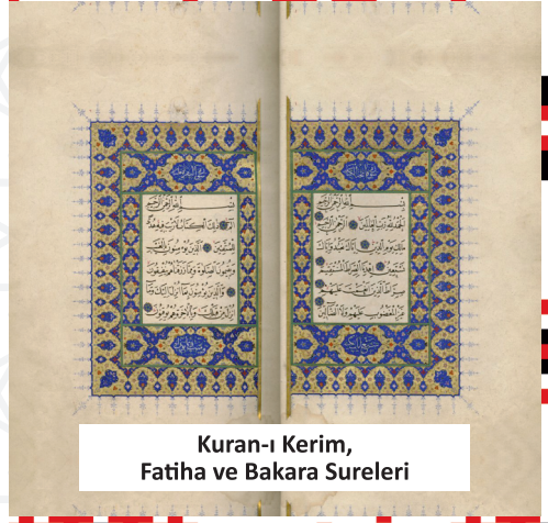
Kuran-ı Kerim, Fatiha ve Bakara Sureleri