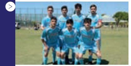
| İstanbul Borsa Başakşehir M.T.A.L