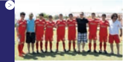
| Ankara Sıteler M.E.M