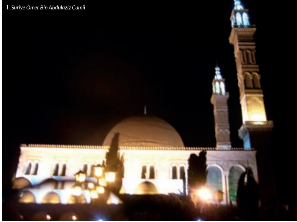
I Suriye Ömer Bin Abdulaziz Camii

dönen iç dünyasının ıstırap yüklü çılgınlıklarına kulak tıkaması, adeta susuzluktan çatlayan dudaklarına zezem olacak adalet adlı deryalara dalma aşkıyla yanıp tutuşmaması mümkün değildir.