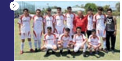
| Manisa Yunus Emre M.E.M