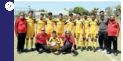
| Mersin Akdeniz M.E.M