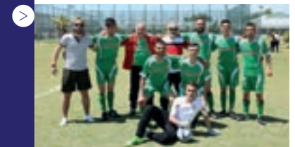
| Samsun İlkadım M.E.M