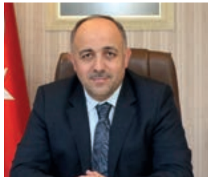
İ İsmail Hakkı Kasapoğlu

"Gençlik ve Spor Bakanlığımızın desteğiyle, Kepenk Spor Kulübü Derneği tarafından hayata geçirilen, "15 Temmuz'un Yiğitleri, Sanayinin Gençleri; Ahiliğin Yolunda Futbol Turnuvası" kapsamında gençlerimizin bir araya gelmesi, yeni yerler görmesi, sosyalleşmeleri açısından önem arz ediyor. Ayrıca Türkiye'mizin birçok yerinden gençlerimizin yer aldığı turnuvaya Samsun'da eğitim gören mesleki eğitim merkezi öğrencilerimizin de katılım sağlaması bizler için ayrıca anlam ifade ediyor. Burada gençlerimiz,