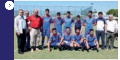
| Malatya Hacı Hasan Kavuk M.E.M