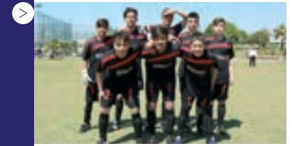
| Gaziantep Yardım Vakfı M.E.M