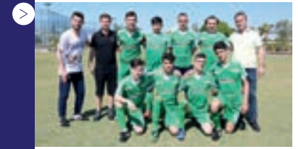
| İstanbul Başakşehir M.E.M