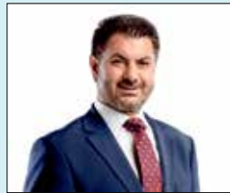
TÜİB Genel Başkanı Hüseyin BÜYÜKFIRAT Azerbaycan'la Türkiye iki devlet bir millettir.