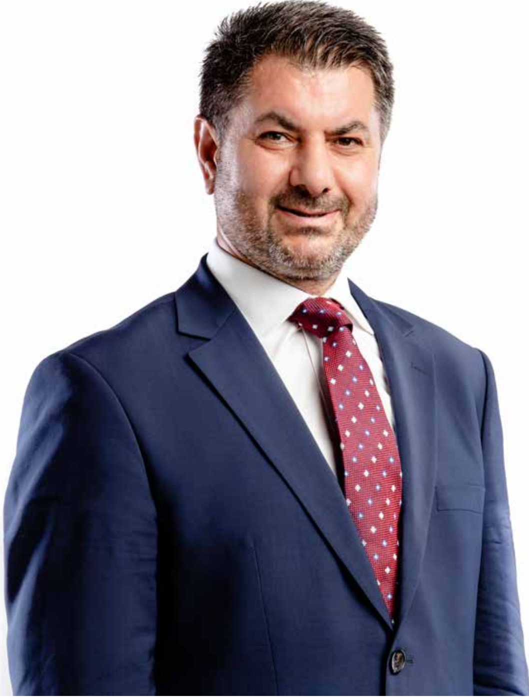
Hüseyin BÜYÜKFIRAT TÜİB Genel Başkanı