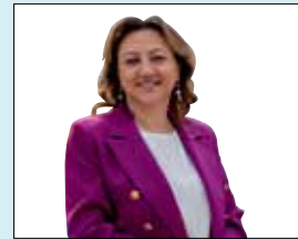
Kültür ve Turizm Bakan Yrd. Özgül ÖZKAN YAVUZ Başkent Kültür Yolu Festivali Coşku ile gerçekleşiyor.