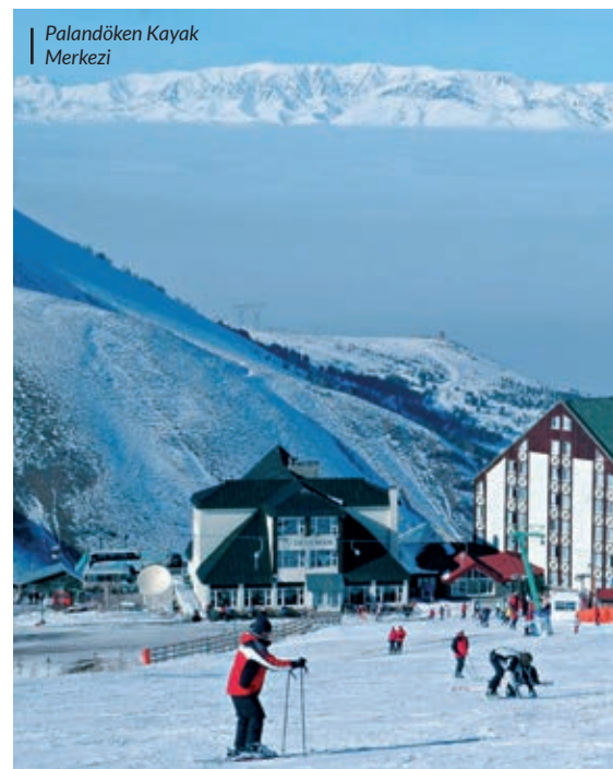
Palandöken Kayak Merkezi