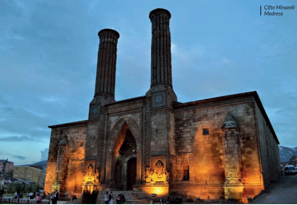
Çifte Minareli Medrese