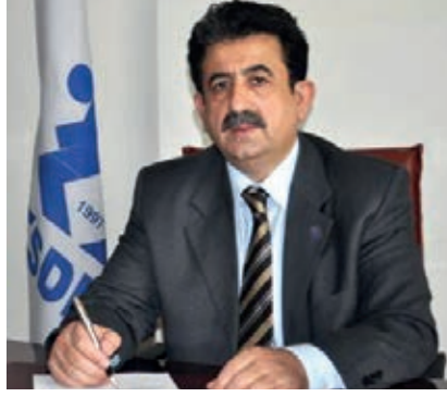
ESDER GENEL BAŞKANI MAHMUT ÇELİKUS: