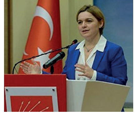
CHP GENEL BAŞKANYARDIMCISI VE BASIN SÖZCÜSÜ SELİN SAYEK BÖKE:

Bu suretle "yeni anayasa", "sivil anayasa" gibi kavramlara sıkıştırılmış ve popülist gündemli yaklaşımlar yerine gerçek ihtiyaç ve sorunların çözümüne odaklanıyor ve yapılacak çalışmalar için "yeni anayasa" yerine "anayasanın yenilenmesi" kavramını kullanmayı tercih ediyoruz. Anayasa konusuna temel yaklaşımımızı ortaya koyan bu kavram mevcut anayasal düzen içerisinde kalarak ülkenin ve milletin talep ve ihtiyaçlarına cevap verebilmenin de bir hukuk devletindeki en münasip yoludur. Çünkü bir hukuk devletinde kimse anayasal düzenin dışına çıkma hakkına sahip değildir. Ayrıca birilerinin deyimiyle bir anayasa yapılıyorsa eğer, bu millete ve bu