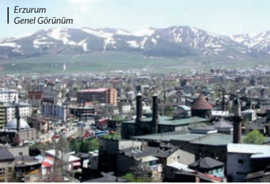
Erzurum Genel Görünüm