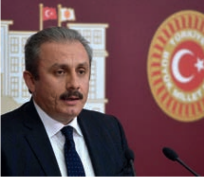
AK PARTİ İSTANBUL MV. ANAYASA KOMİSYONU BŞK. PROF.DR. MUSTAFA ŞENTOP: