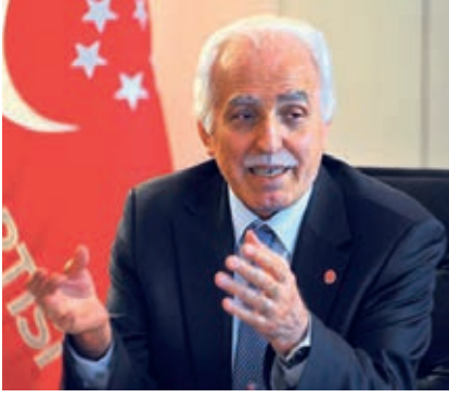
SAADET PARTİSİ GENEL BAŞKANI PROF.DR. MUSTAFA KAMALAK: