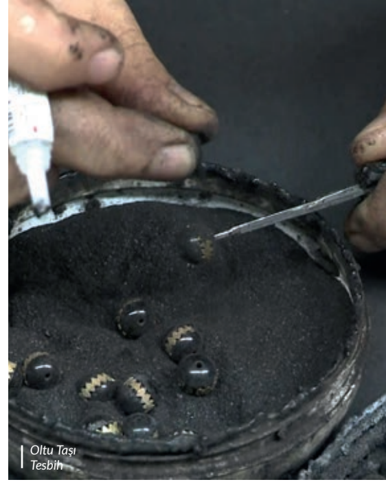
Oltu Taşı Tesbih

> hakim bir tepe üzerinde kurulu bulunan Erzurum Kalesi'nin surlarındaki Saat Kulesi her taraftan çok rahatlıkla görülebilmektedir. 1297-98 yıllarında İlhanlıların Veziri Emir Çoban Salduz tarafından yaptırılmıştır. Aras nehri üzerinde 7 kemer gözlü olarak inşaa ettirilen önemli bir yapıttır. Kanuni Sultan Süleyman'ın Sadrazamı Rüstem Paşa tarafından yaptırılmıştır. Osmanlı mimarisinin özelliklerini taşıyan iki katlı bina halen çarşı olarak kullanılmaktadır. Çarşıda daha ziyade oltu taşı satıcıları faaliyet göstermektedir.