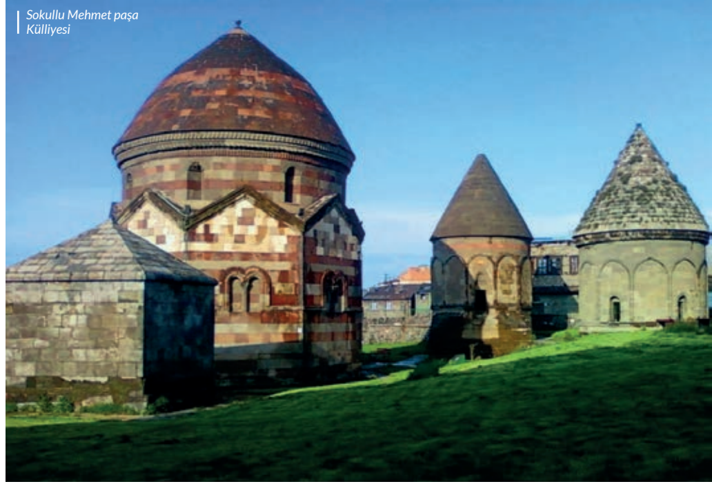
Sokullu Mehmet paşa Külliyesi